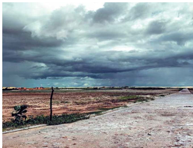
JESSICA DAYANE, PORTAL MEIO NEWS

A Secretaria de Meio Ambiente e Recursos Hídricos (Semarh) informou por meio de um boletim semanal que para esta semana são esperadas pancadas de chuva em todas as regiões do estado. Porém, as chuvas de maior intensidade e mais volumosas estão previstas para a porção do estado que faz fronteira com o Ceará.